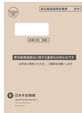
社会保険報酬月額算定基礎届