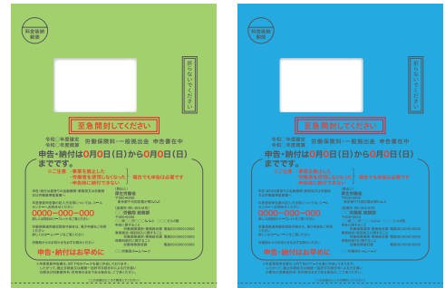
労働保険料・一般拠出金 申請書